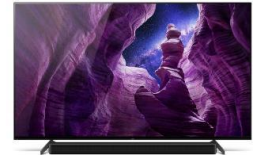
Pieds en position haute pour barre de son