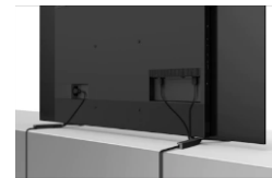
Passage de câbles intégré