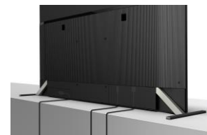
Passage de câbles intégré