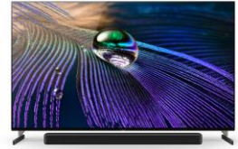
Pieds en position haute pour barre de son