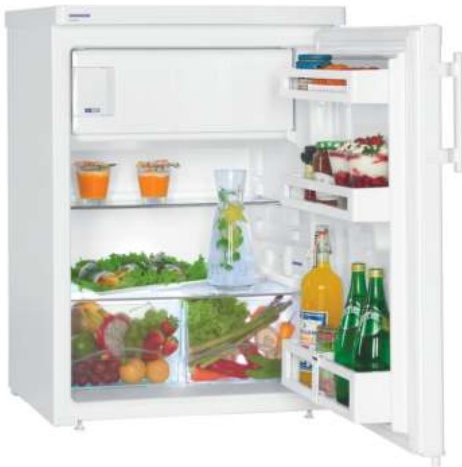
Table top 60 cm 4* Comfort