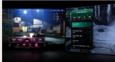
TABLEAU DE BORD & OPTIMISEUR DE JEU

L' intelligence artificielle s'invite dans votre interface webOS. Avec LG ThinQ , commandez votre téléviseur à la voix, que ce soit pour trouver votre prochain contenu à regarder en fonction de vos goûts, pour contrôler les objets connectés de votre foyer ou encore pour faire une requête à votre AI ChatBot .