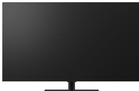
Pied central double position en hauteur